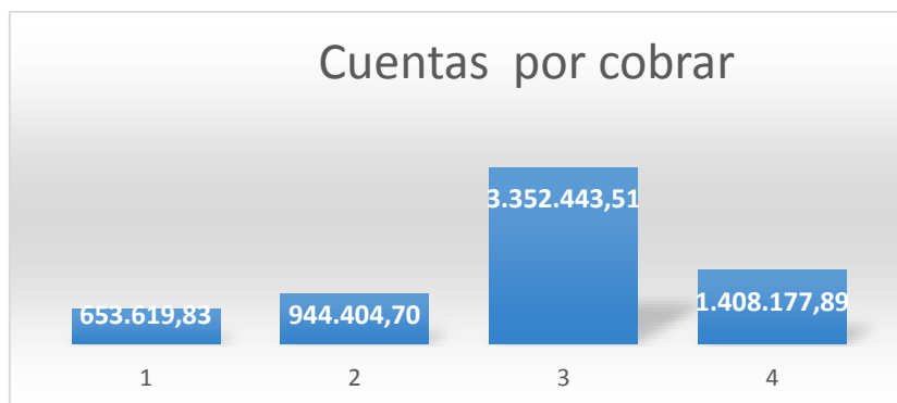
Figura 1. Saldo de las cuentas por cobrar del período 2016-2020. Fuente: Elaboración propia.