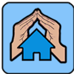
Figura 1- Logotipo