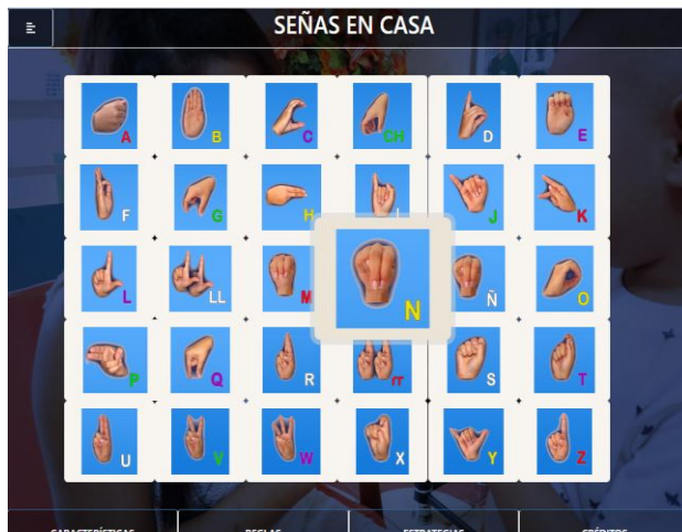
Figura 4- Dactilemas